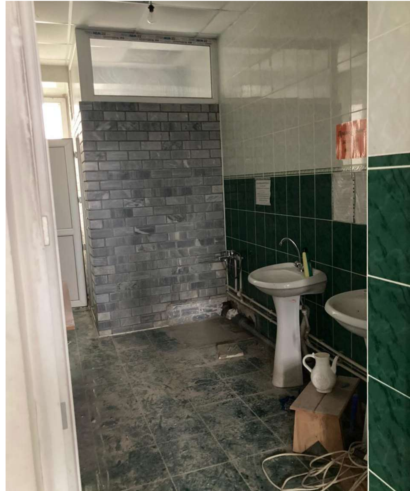
Санузел в мечети Аль Иман