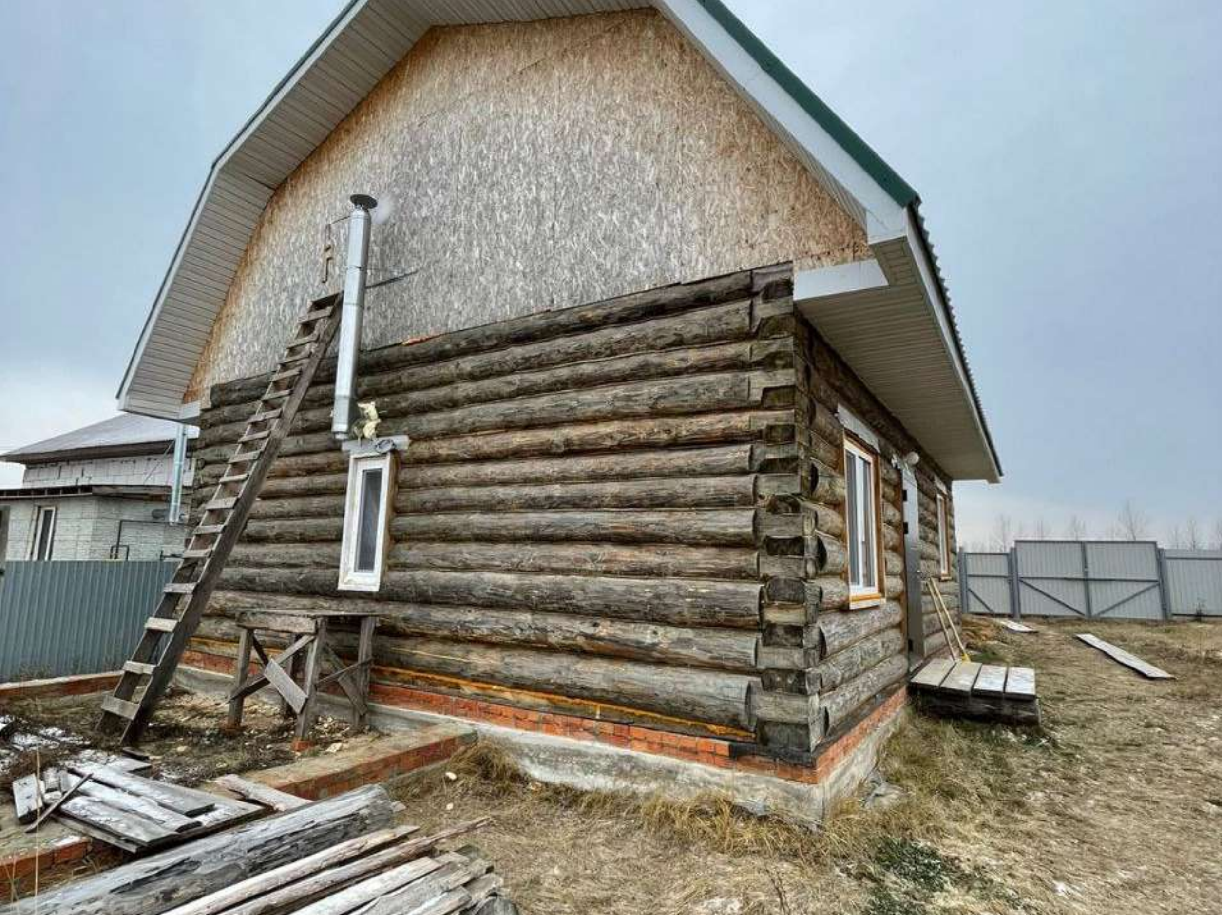
Дом Нуршад хазрату. Гильдеево