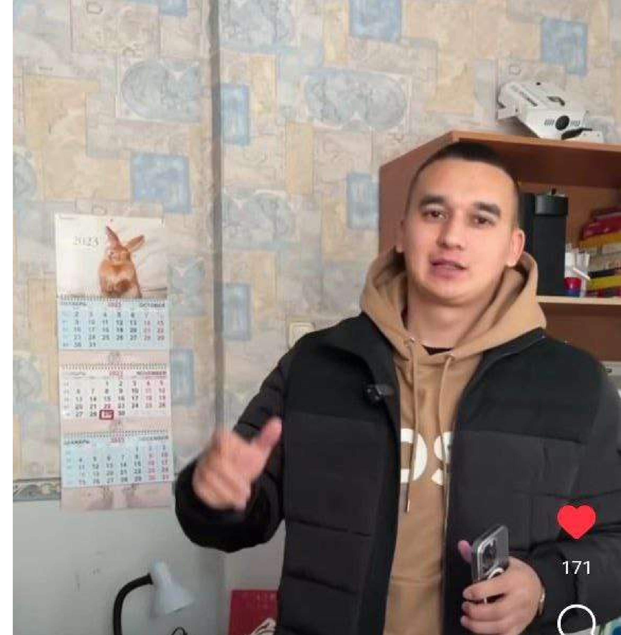
Ремонт помещения в детском доме