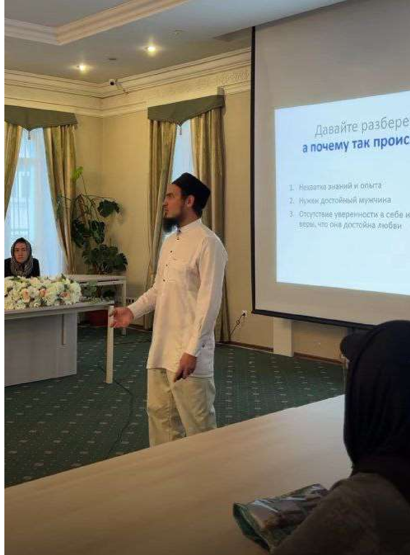
Семинар для подопечных по построению семьи