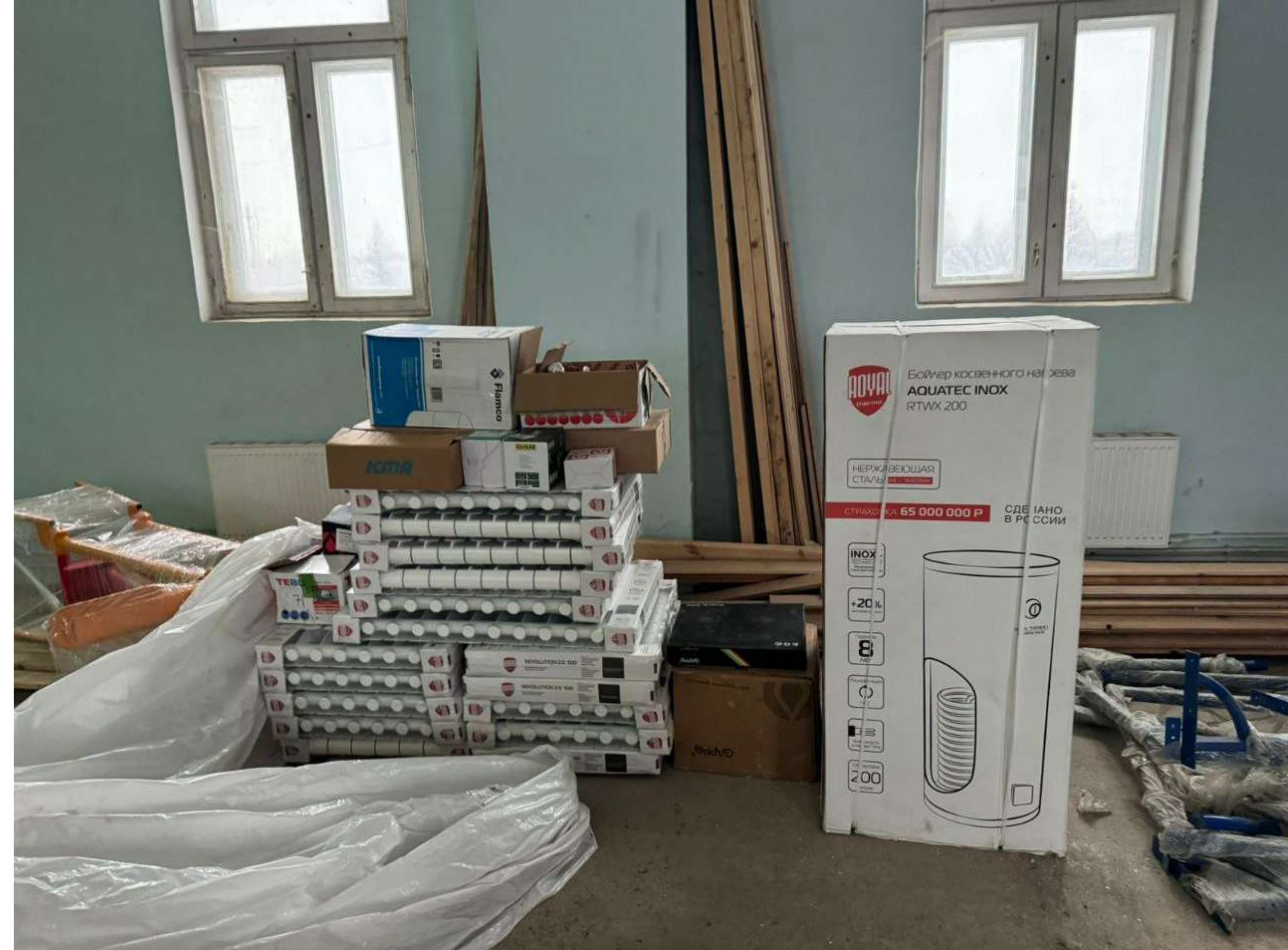
Сантехника в маетхана Арск