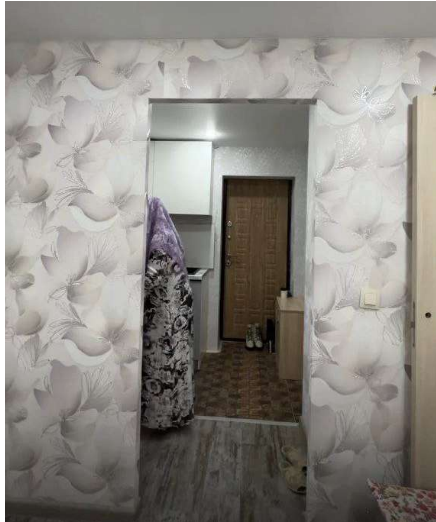
Квартира Альфия апы