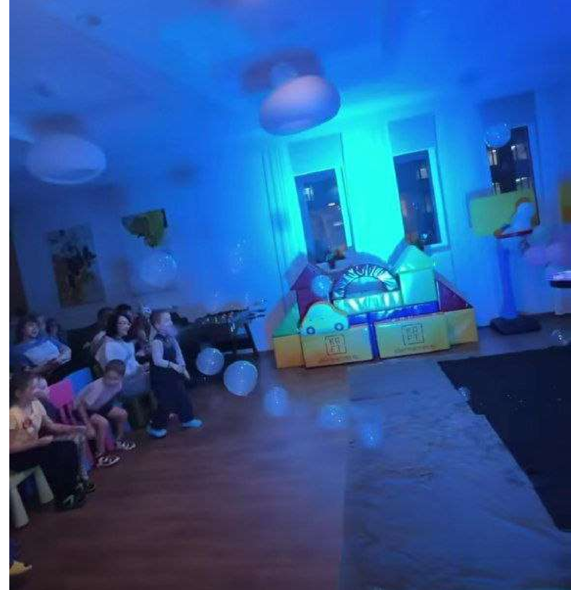
Праздник детям в доме Роналда Макдональда