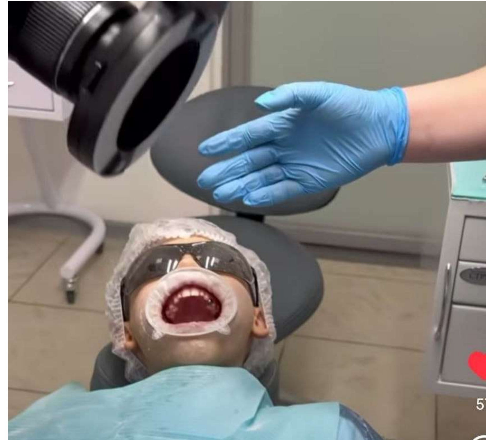
Лечение зубов нашим подопечным