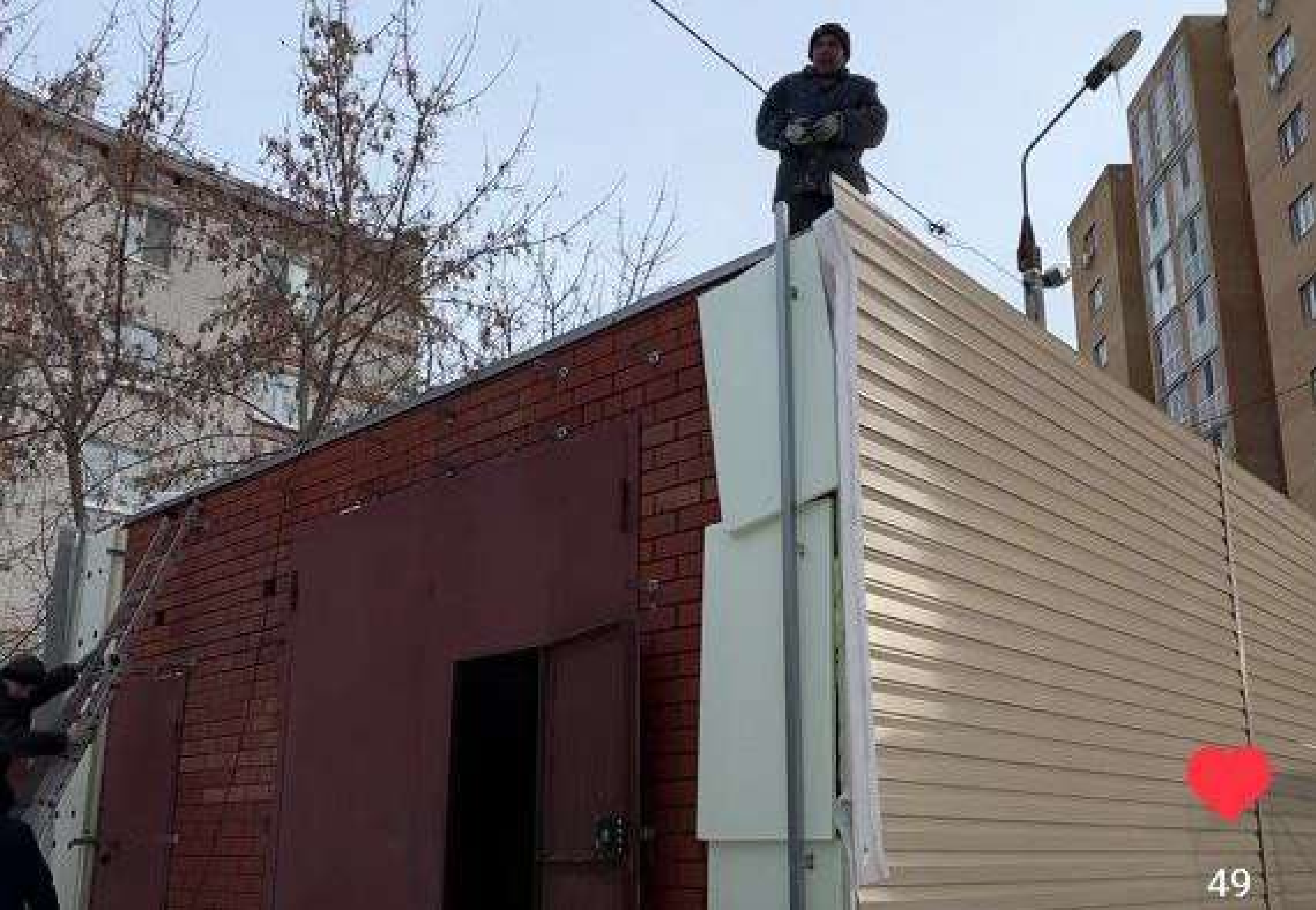
Реконструкция гаража в детском доме