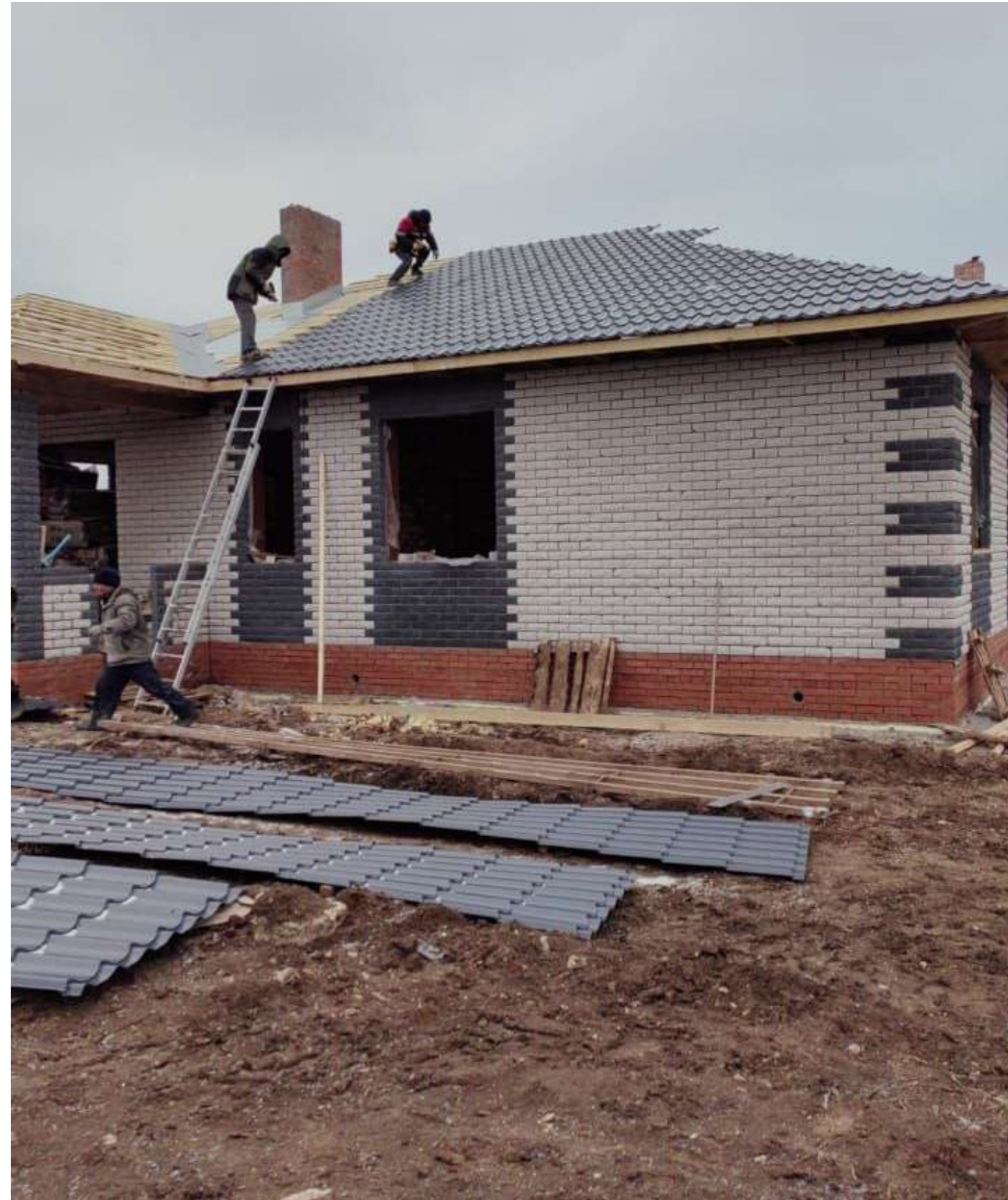
Дом Абдуль Хаким хазрату. Камские поляны