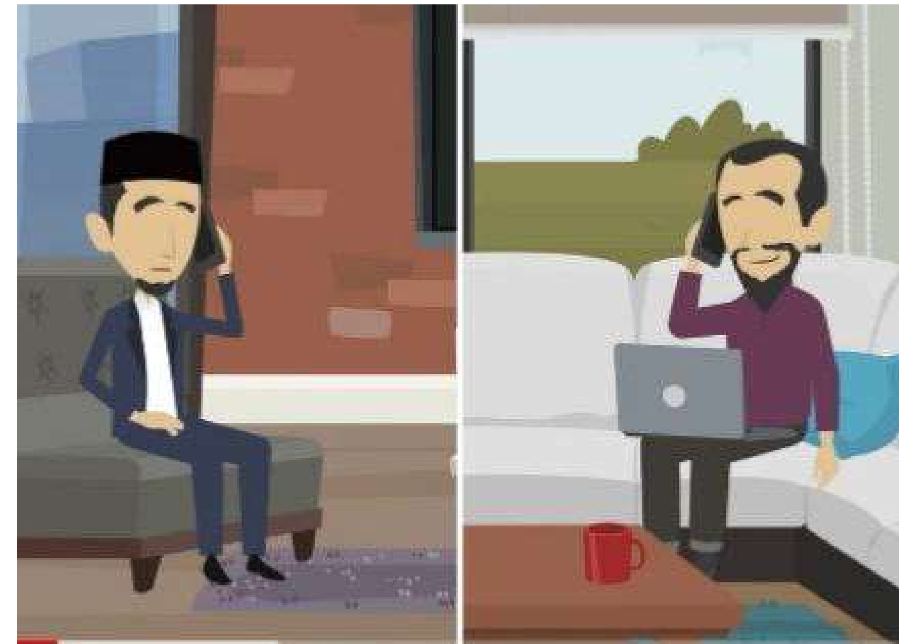
Тебе доверился! | Предательство Т на доверие