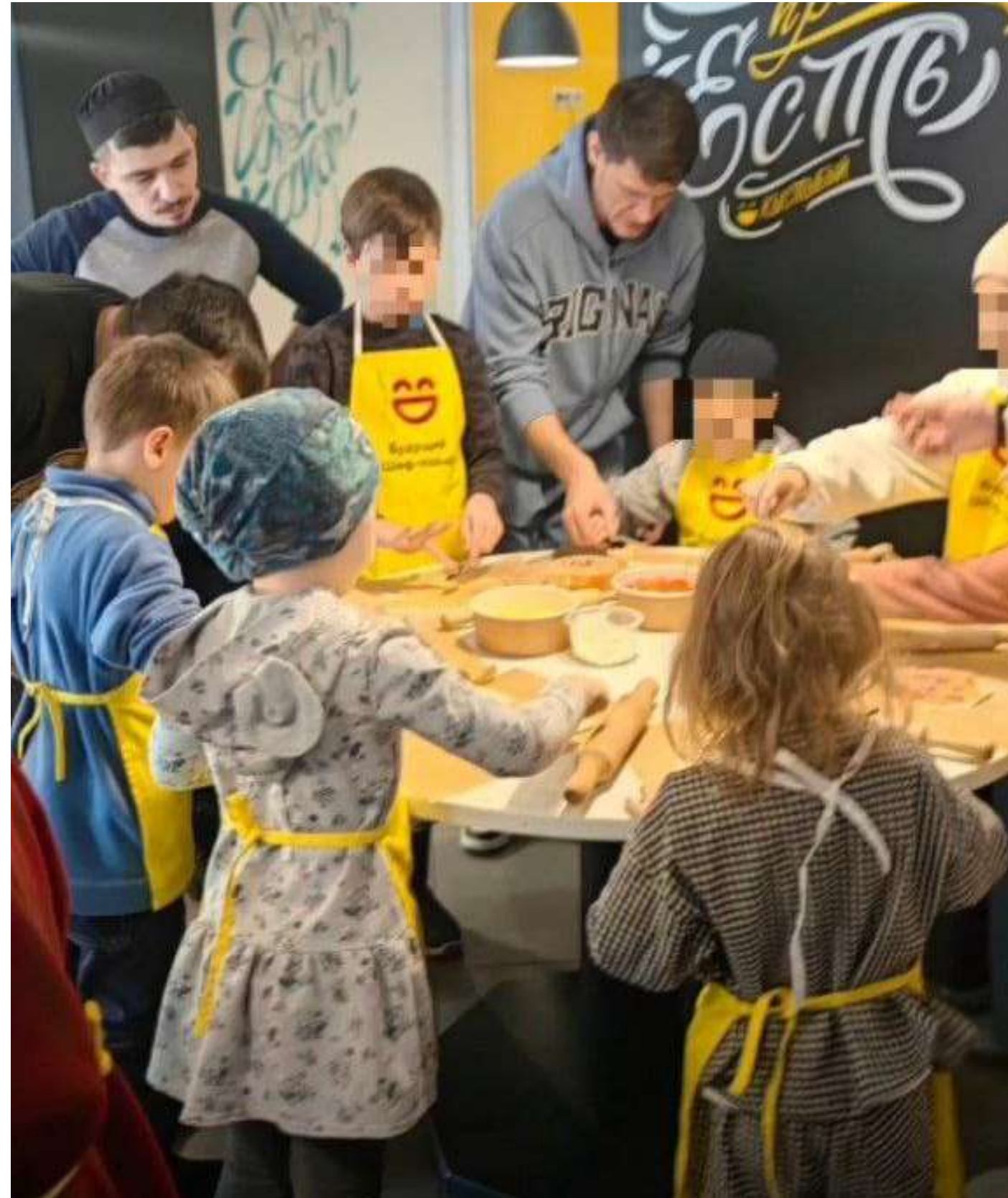
Готовим пиццу вместе с нашими подопечными